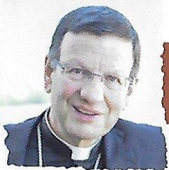
Mgr Benoît Rivière évêque d'Autun